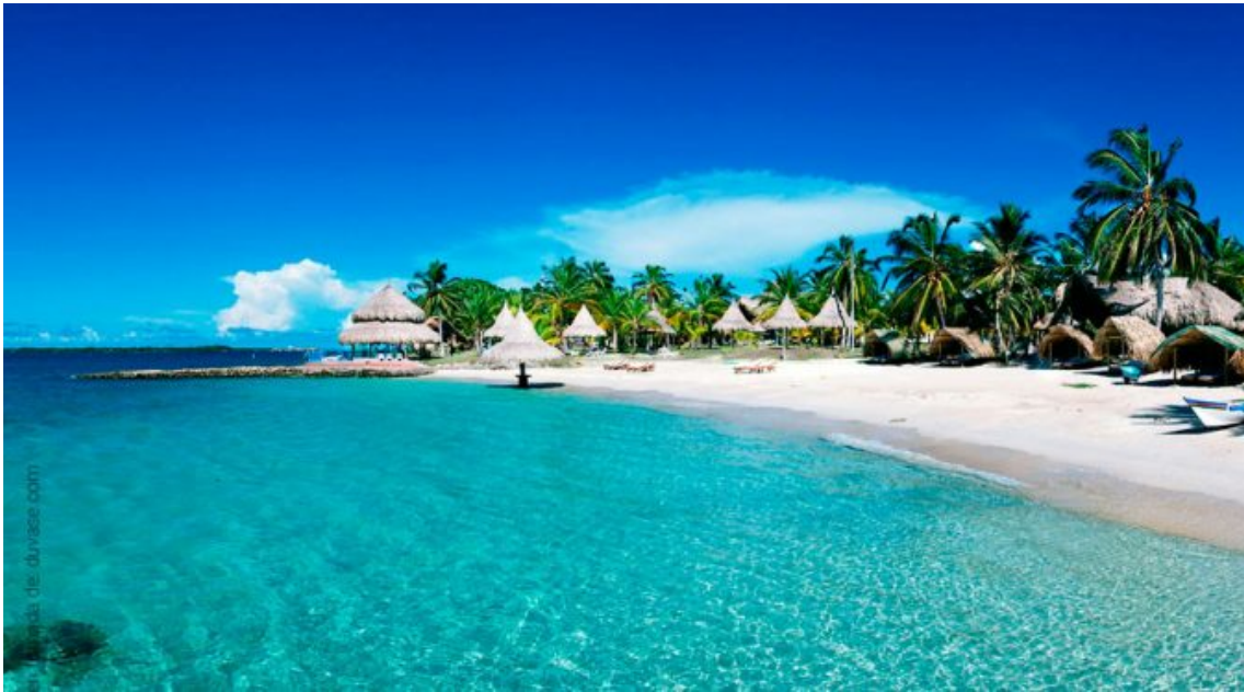
Barú – Playa Blanca